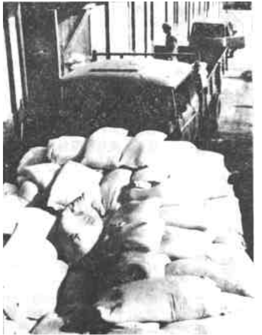
市面粉加工厂为保证春节期间面粉供应，从1月初即开始加班加点不停“车”，日加工小麦30万公斤，已调出精粉25万公斤。图为调运库一角。