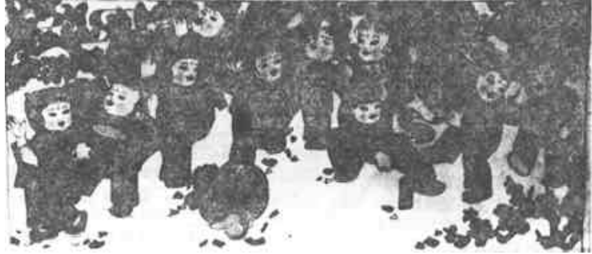
闹春 (年画) 陈宏光