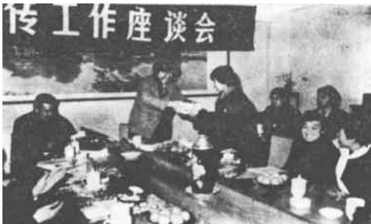
“向社会宣传妇女,向妇女宣传社会”。市妇联狠抓宣传工作,去年,在中央、省、市三级报刊、电台发稿278篇。图为市妇联主任向优秀通讯员颁发奖品。